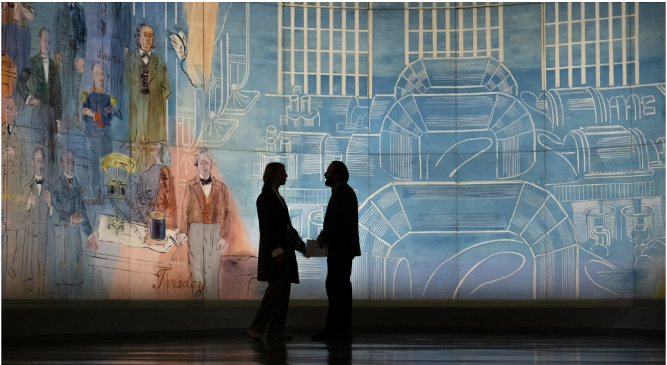
Tagebuch einer Pariser Affäre