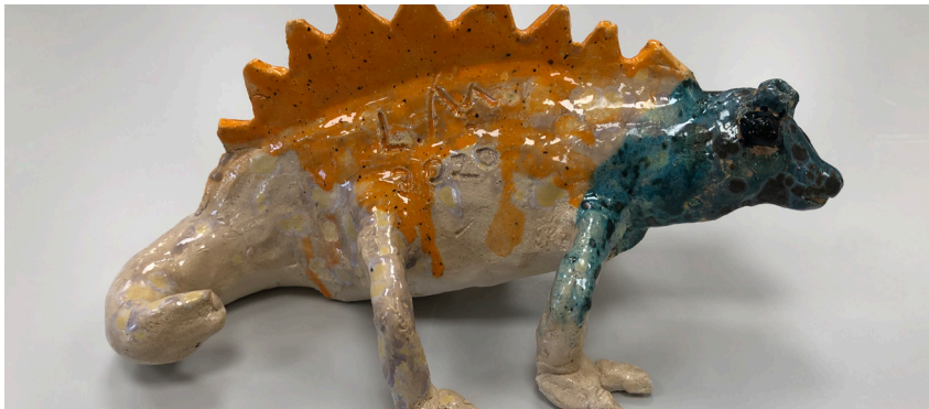
Modellieren mit Ton/Gertrude Maderthaner

W23609: Mi, 27.09.2023 bis 22.11.2023, 18:30-21:00 Uhr S246010: Mi, 10.01.2024 bis 06.03.2024, 18:30-21:00 Uhr S246011: Mi, 20.03.2024 bis 22.05.2024, 18:30-21:00 Uhr Dauer: 8 Wochen zu je 2 Stunden und 30 Minuten Kursleitung: Sigrid Brunnhaller, Schneiderin Ort: VHS, Anzengruberstraße 3, 2. Stock, 3300 Amstetten Gebühr: € 105,00