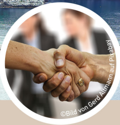
VON UNS FÜR SIE: 100%-SORGENFREI-PACKAGE