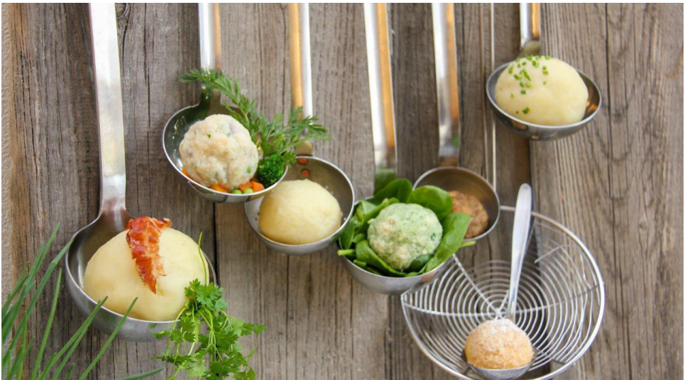
Bäuerliche Knödelküche/Elisabeth Heidegger/LK NÖ

Gebühr: € 33,00 exkl. € 17,00 Materialkosten